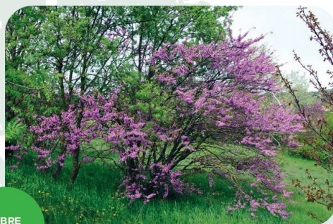
ARBRE DE JUDÉE